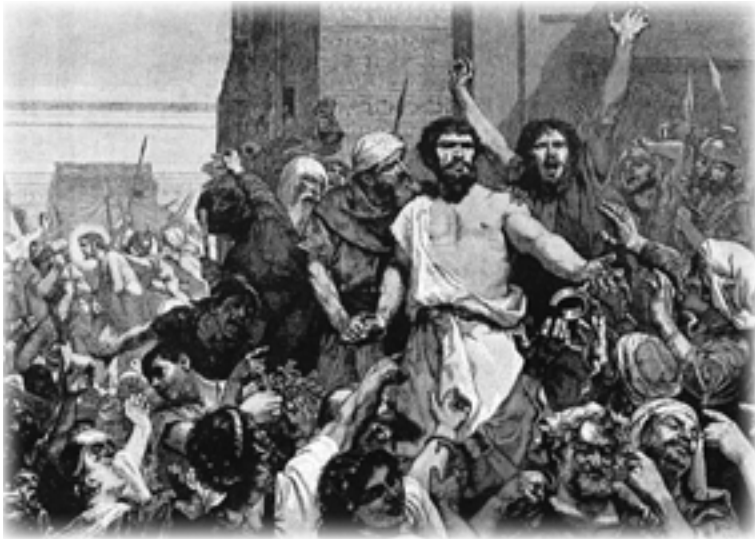
Освобождение Вараввы (гравюра 19 века)

дном, ушли ни с чем. Иуде тогда удалось скрыться в горах, но через год они вернулись и схватили его.