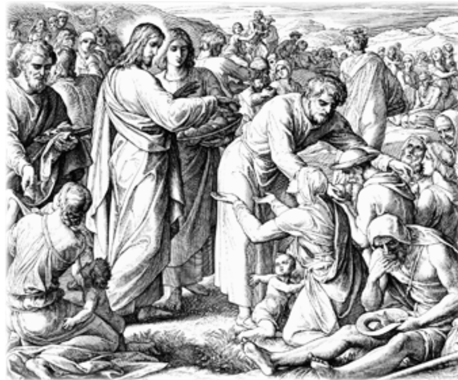
Чудо преумножения хлебов и рыб Шнорр фон Карольсфельд Юлиус (1794—1872)

Митрополит Антоний (А.П.Храповицкий) глава Русской Зарубежной Церкви в 1921–1936 годах, писал по этому поводу, что главным в этом Чуде для народа было не насыщение пяти тысяч человек двумя рыбками и пятью хлебами, а то, что Иисус мог бы обеспечить пищей народных повстанцев. Они не теряли надежды