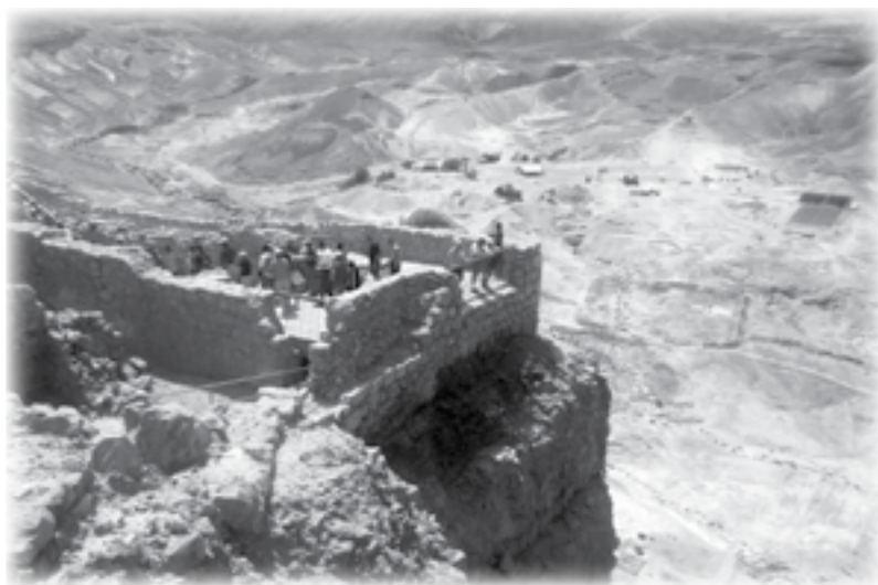
Туристы на смотровой площадке крепости Масада

– А ты так ничего и не понял, Элиазар? – Бар-Абба задумчиво посмотрел на брата, и кажется, совсем протрезвел. Уходи отсюда, малыши, беги из этого города! Тут все прогнило, все подкуплены Каиафой и его шпио-