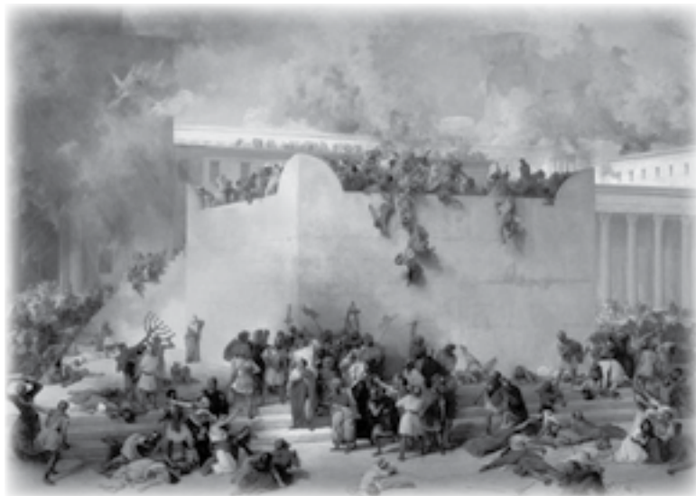
Разрушение Иерусалимского Храма Франческо Хайез ((1791 – 1882)

Когда сын Веспассиана Тит ворвался в осажденный